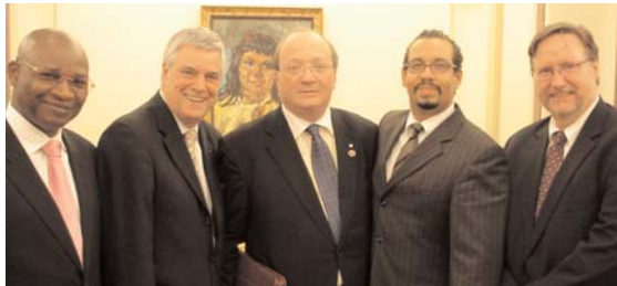
Le sénateur Hugh Segal (au centre) préside le comité permanent des affaires étrangères du Sénat. Ce comité publiera en septembre son rapport sur les relations entre le Canada et l'Afrique.

Nous sommes très heureux de publier ce numéro d'été du bulletin du CCAfrique. Il s'agit du premier numéro depuis le lancement de notre Service de développement des affaires , nous sommes fiers de vous en parler et de vous faire part des commentaires positifs que ce service a suscités. Ce numéro comprend aussi une brève analyse d'un sondage que nous avons mené auprès des membres avant l'Assemblée générale annuelle tenue en juin dernier, en plus de décrire plusieurs événements passionnants qui se dérouleront cet automne, dont une mission d'affaires en Afrique de l'Est et notre conférence sur " Les ressources naturelles et le développement économique africain " qui aura lieu à Calgary.