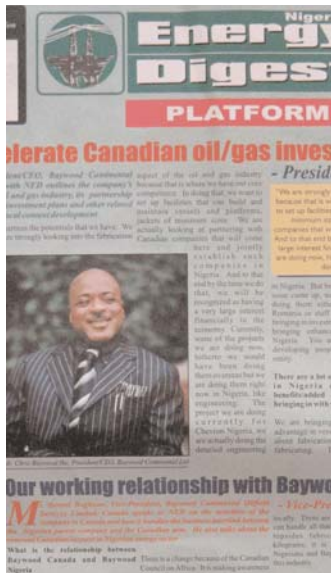
La mission du CCAfrique au Nigeria en avril dernier a fait l'objet d'une grande couverture médiatique. Des articles ont notamment été publiés à la une de la presse d'affaires locale.