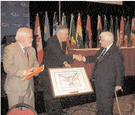
Un hommage a été rendu à Paul Gérin-Lajoie (à droite) pour sa contribution au monde de l'éducation et au développement au cours de sa carrière politique et publique.

Le Conseil canadien pour l'Afrique a eu des échos très favorables à l'issue de la conférence. L'événement a offert aux Canadiens et aux Africains une tribune unique où ceux-ci ont pu partager leurs réflexions sur les principales questions qui touchent l'Afrique, son développement économique et ses systèmes d'enseignement. La conférence a aussi permis de nouer des relations et de raffermir celles qui existaient déjà. Voici un extrait des commentaires d'un de nos conférenciers invités :