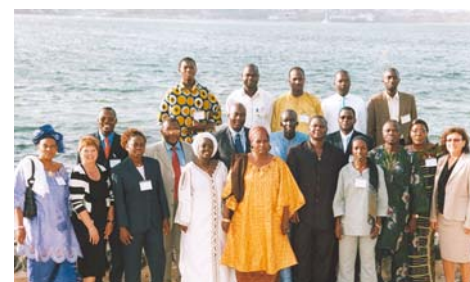
Les participants au séminaire « La gestion des ressources humaines », à Dakar

Du 2 au 4 avril se tenait à Dakar un séminaire technologique qui se voulait à la fois formateur, informatif et interactif. Ainsi, un mélange de présentations techniques, d'ateliers et de conférences étaient au menu. L'objectif final était d'en ressortir avec une vision partagée des différents enjeux abordés. Des représentants de 10 réseaux d'institutions de microfinance d'Afrique de l'Ouest ainsi que de la Confédération des institutions financières (CIF) étaient présents. Les conclusions ont porté sur l'importance, pour les partenaires de DID, de développer des technologies qui soient orientées vers le service aux membres et intégrées aux systèmes déjà en place.