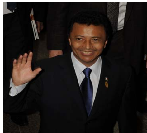
S.E. Marc Ravalomanana, Président de la République de Madagascar

ne détruira certainement pas le développement économique de l'Afrique et que beaucoup de projets positifs sont en cours. Il a également