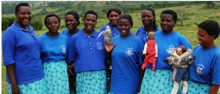
Les volontaires de la communauté de la région de Katyzazo montrent les marionnettes qu'elles ont confectionnées

HCU adopte trois approches à la survie des enfants en créant des capacités au niveau de l'université, du centre de santé et de la communauté. HCU travaille avec les citoyens locaux pour identifier et résoudre les prob-